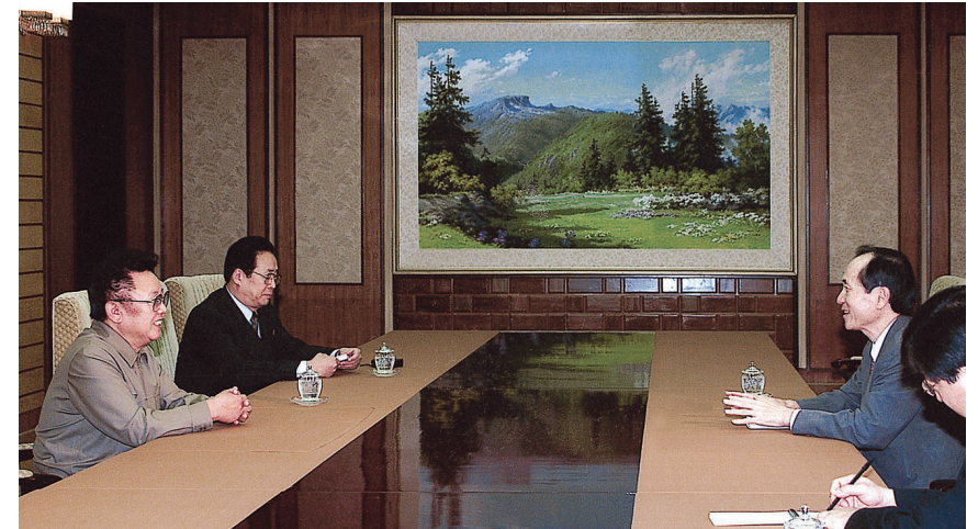
2000.9.1 자강도 특별초대소에서 김정일 위원장과 군사문제를 비롯한 남북 현안에 대해 집중 토의 In-depth discussions with Chairman Kim Jong-il at the Jagangdo Special Guesthouse on military issues and other inter-Korean matters, Sept. 2000