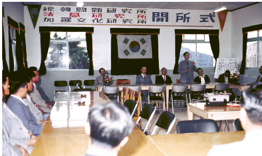
1972.9.1 경남대 극동문제연구소 개소식 Opening of IFES, Sept. 1972

주목해야 할 점은 그가 수교 이전부터 공산권 국가들과의 ‘학술 외교’를 통해 닫힌 문을 열었다는 사실입니다. 한국과 중국이 수교 전인 1986년 9월, 박재규 총장은 중공 정부와 일본 무역회사의 협조로 베이징을 방문하여 공산권 연구를 위해 한국 대학생