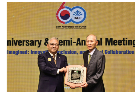
2025.10.14 IAUP 창립 60주년 기념 국제세미나서 공로상 수상 Received a Distinguished Service Award at the IAUP 60th Anniversary International Seminar, Oct. 2025