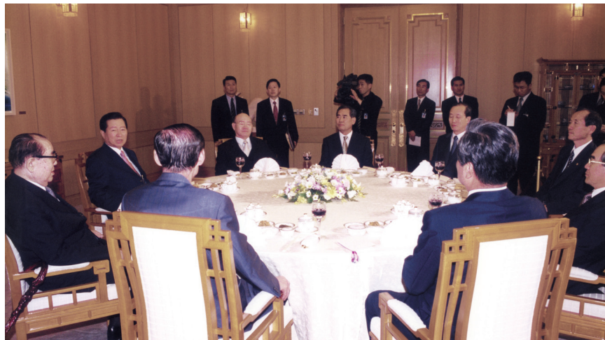
2000.4 최규하, 전두환, 노태우 전 대통령에게 남북정상회담 배경 등 설명 Explaining to former Presidents Choi Kyu-hah, Chun Doo-hwan, and Roh Tae-woo the background of the inter-Korean summit, Apr. 2000

김정일 위원장과 조찬을 함께하며 끈질긴 설득 끝에 남북국방장관회담 개최에 대한 약속을 받아냈고, 시드니 올림픽 남북 공동 입장에 대해서도 “긍정적으로 검토하겠다”는 답변을 이끌어냈습니다. 이러한 극적인 노력의 결과로 제2차 장관급회담은 한반도의 군사적 긴장 완화와 신뢰 구축의 발판이 된 군사당국자회담 개최 합의라는 큰 성과를 거둘 수 있었습니다. 프랑스 시라크 재단이 그에게 분쟁방지 특별상을 수여한 것 또한 이러한 남북 화해·협력 정책 수행을 통해 한반도 평화 정착에 기여한 공로를 높이 평가했기 때문입니다.