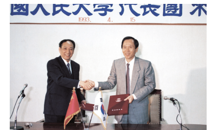
1993.4 1986년 시작된 중국과의 교류는 1993년 중국 인민대학과 경남대학이 학술교류 협정을 체결하는 것으로 이어졌다.

What should be noted is that even before the establishment of South Korea’s official ties with countries of the former Socialist bloc, through ‘academic diplomacy’ with