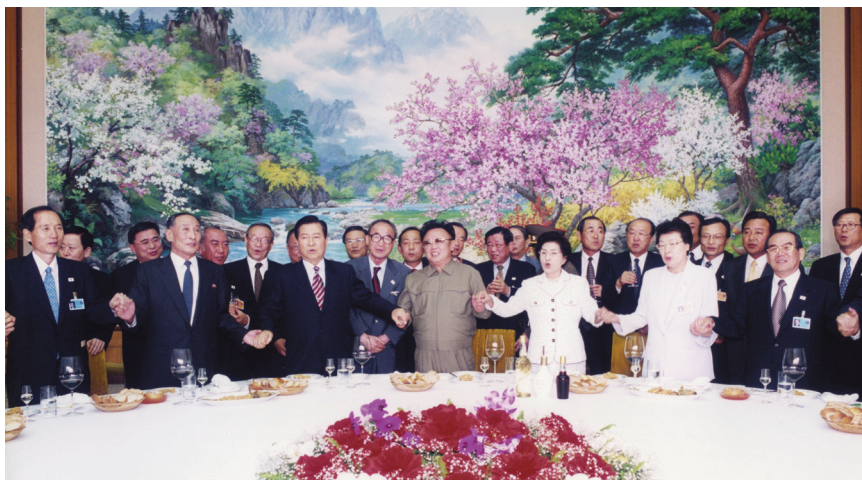
2000.6.15 우리의 소원은 통일 Banquet, Inter-Korean Summit, June 2000

당시 그는 6월 14일 만찬 자리에서 김정일 국방위원장의 바로 옆자리에 앉아 이산가족 문제 해결, 경의선 철도 연결, 사회문화 교류 및 협력 등 남북 관계 발전을 위한 심도 있는 대화를 나누었고, 이러한 노력은 ‘6.15 남북공동선언’이라는 역사적 결실로 이어졌습니다. 정상회담 이후에도 그는 공동선언의 합의 사항을 이행하기 위해 남북 장관급회담의 우리 측 수석대표로서 대화의 원칙과 기준을 정립하며 남북관계 도약을 주도했습니다.