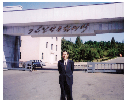
1998.9 김일성종합대학 정문 앞에서 Visit to Kim Il Sung University, Sept. 1998