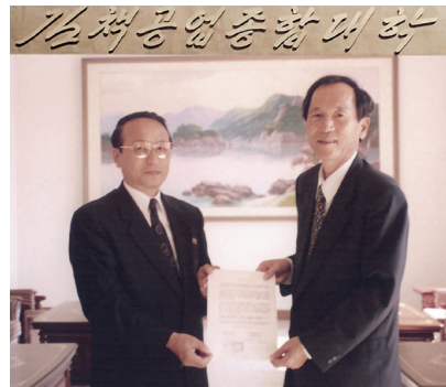
1998.8.25 김책공업종합대학과 학술교류 MOU 체결 Signing MOU with Kim Chaek University in Pyongyang, Aug. 1998

이러한 현장 경험과 축적된 성과를 바탕으로 1989년 국내 대학 최초로 행정대학원 내에 ‘북한학과’를 개설하여 평화통일 시대에 필요한 전문 교육을 본격화했습니다. 이를 기반으로 1998년에는 남북 교류 협력 시대를 대비한 국내 최초의 북