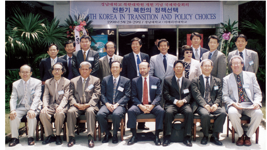
1998.5.28.-29 북한대학원 개원 기념 국제학술회의 Graduate School of North Korean Studies inaugural conference, May 1998