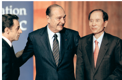
2009.11.6 Chirac 전 대통령과 Sarkozy 대통령이 축하하는 모습 Celebrating with former French presidents Chirac and Sarkozy, Nov. 2009