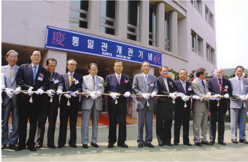
2004.6.15 통일관 개관식 Opening ceremony of UNKS Unification Hall, June 2004

한 전문 대학원인 ‘경남대 북한대학원’을 개원하였고, 2004년에는 이를 ‘북한대학원 대학교’로 승격·독립시켜 경남대 극동문제연구소와의 협업을 통해 연구·교육이 상호 연계되어 시너지 효과를 내는 모범적인 모델을 완성했습니다. 북한 관련 연구와 교육을 접목하여 실질적인 효과를 창출하고 연구의 기반 구축과 질적 제고를 이뤄낸 것입니다.