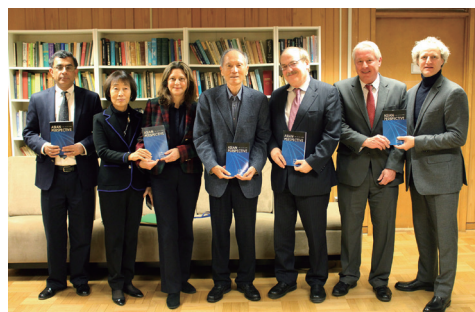
2018.11 Asian Perspective 미국 존스홉킨스대 출판부와 공동 발간 Meeting with Johns Hopkins University Press for publication of Asian Perspective, Washington DC, Nov. 2018