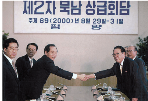
2000.8.29-31 제2차 남북장관급회담 The Second Inter-Korean Ministerial Talks, Aug. 2000