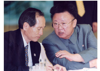
2000.6.14 김정일 위원장 옆 자리에 앉아 남북관계 발전을 위해 중요한 대화를 나눴다.